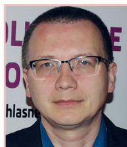
Kežmarok, 15. mája 2017

Člen Správnej rady a predseda Rozhodcovskej komisie ZVLD SR