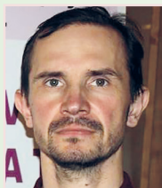
Námestovo, 15. mája 2017

Aké zmeny prináša vlastné profesijné združenie ZVLD SR?