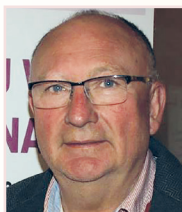
Brezno, 15. mája 2017