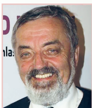
Velký Šariš, 15. mája 2017

Keď už nemôžeme mať jednu odbornú spoločnosť, nech máme jediné Združenie VLD! Nech veci u nás fungujú tak, ako v ČR. Čo vy na to, kolegovia všeobecní lekáři? Napriek viacročným snahám o zlúčenie 3 odborných spoločností je výsledok neúspešný! Nezlučili sa, podobne je to so spájaním Zdravita so ZAP-om. Tiež rádio Jerevan opakovane hlásilo, že sa zlúčia, ale stále nič a výsledok je v nedohľadne. Všetko je v rukách vedúcich funkcionárov jednotlivých