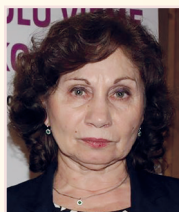
Spišská Nová Ves, 15. mája 2017